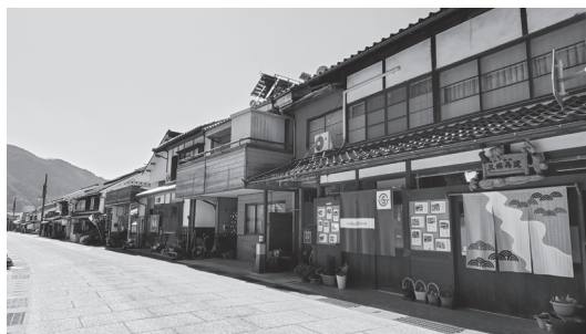
勝山町並み保存地区

白壁や格子窓の建物が並び、江戸時代の城下町の面影を残し、各家の軒先に掲げられたのれんが彩りを添える風情あるエリアになっており、多くの観光客が訪れています。