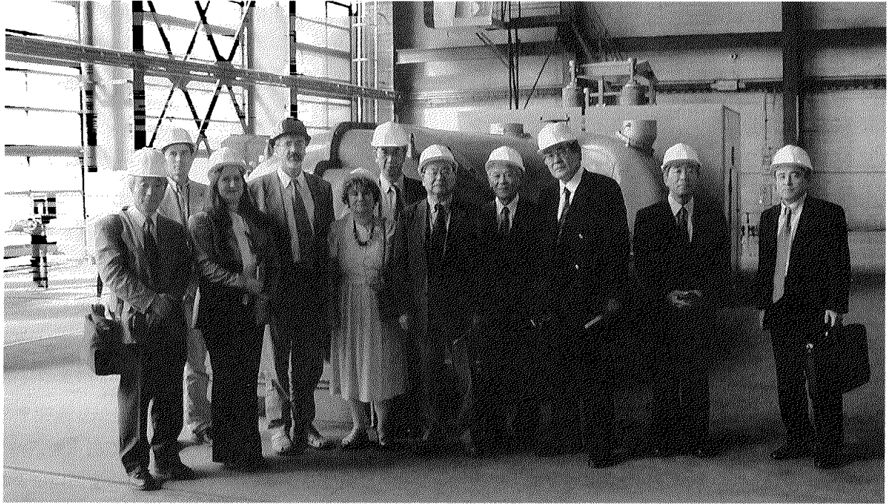
写真1 ブタペスト市焼却施設にてハンガリー環境・水省スタッフと調査団一行