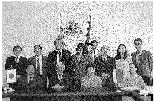
写真3 ブルガリア環境・水省スタッフと調査団一行